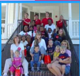
El Centro de los Recursos de los padres

El programa de Los Saltadores de Los Charcos es un programa entre “la madre y mi” que está diseñado para los niños de dos y tres años. El programa está en asociación con el proyecto de “La Intervención temprano de Los Pasos de Piedras” (Stepping Stones) y el programa del Título I del Sistema de las Escuelas del Condado de Coweta. La intención de éste programa es enseñar a los padres las habilidades que les ayudaron a obrar entre si y los niños mas efectivamente. Éstas habilidades ayudaron sus niños ser más preparados para los años tempranos de la erudición.